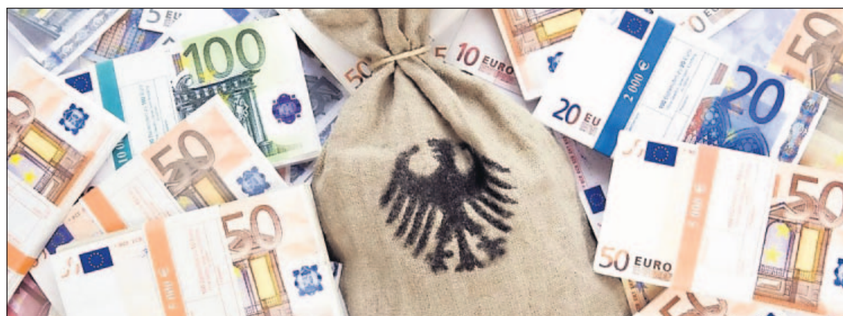
Zu den steuerbegünstigten Sonderausgaben zählen Spenden für gemeinnützige, mildtätige sowie kirchliche Zwecke.

Zu den steuerbegünstigten Spenden zählen Spenden für gemeinnützige, mildtätige sowie kirchliche Zwecke. Seit der Steuererklärung 2007 sind erstmals Spenden einheitlich absetzbar – bis zu 20 Prozent des Gesamtbetrags der Einkünfte. Neu ist ferner, dass Zuwendungen, die den Höchstbetrag übersteigen, in das Folgejahr vorgetragen und dort im Rahmen des Höchstbetrags berücksichtigt werden. Dieser Spendenvortrag gilt zeitlich unbegrenzt. Anders werden Spenden an politische Parteien behandelt. Bis zu einem Betrag von 3300 Euro (Alleinstehende) und 6600 Euro (Verheiratete) werden die Zuwendungen steuerlich begünstigt: Zu 50 Prozent sind sie direkt von der Steuerschuld abzugsfähig, die übrigen 50 Prozent werden als Sonderausgaben geltend gemacht.