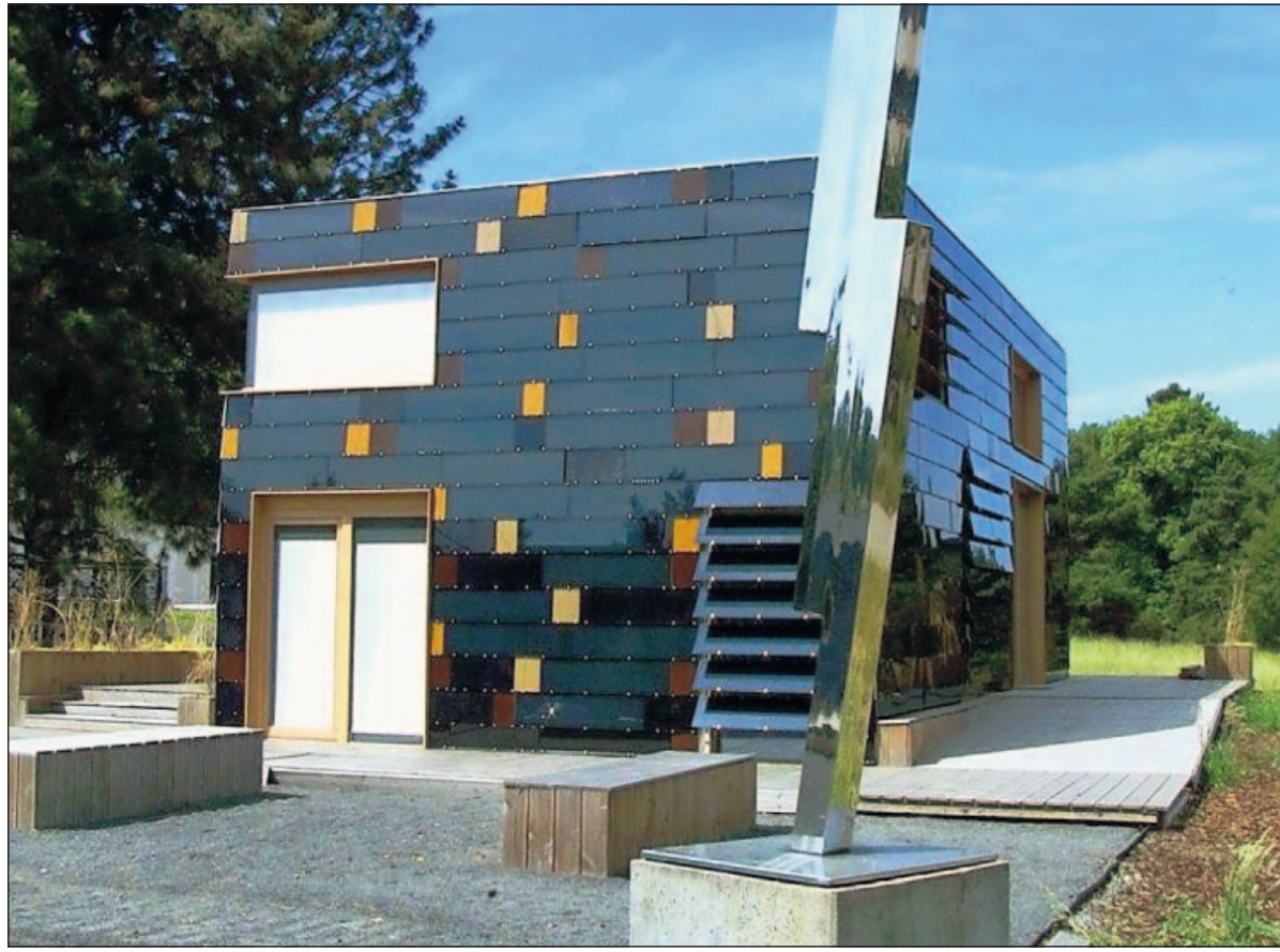
Energieautark und in modernem Design gestaltet: das Energie-Plus-Haus der TU Darmstadt.

Insbesondere ABB war in der Vergangenheit immer wieder im Zusammenhang mit rechtswidrigen Absprachen aufgefallen. Die Beschuldigten haben nun die Möglichkeit, sich zu den Vorwürfen zu äußern. ABB, Nexans und Prysmian kündigten an, mit den Behörden zu kooperieren. Der größte deutsche Kabelhersteller Leoni ist von dem Verfahren nach eigenen Angaben nicht betroffen.